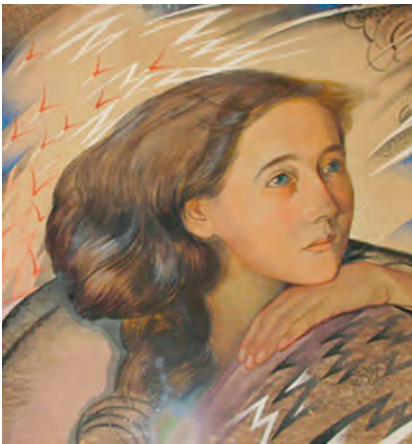
Дівочий портрет. 1901 р.