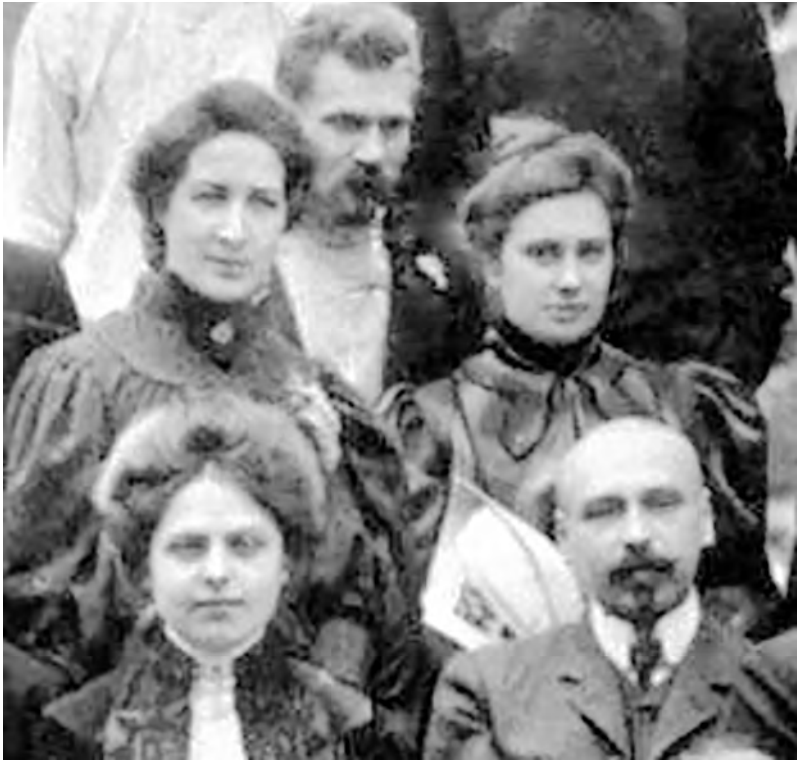
Працівники Чернігівського міського статистичного бюро. Оточення Коцюбинських

що Михайло Жук як особа некон'юнктурна майже не створював замовних портретів, зображуючи переважно людей близького кола. Наприклад, у перший чернігівський період це майже виключно особи, з якими контактував автор: люди з оточення М.М. Коцюбинського, члени «Просвіти», літературного гуртка, службовці Чернігівського земства чи члени родини художника.