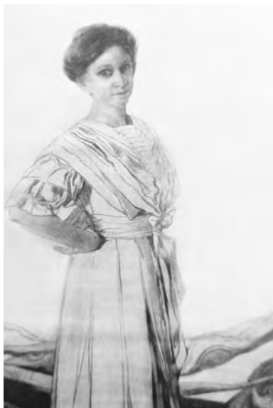
Портрет дружини. 1910-ті роки

Щодо помилкової атрибуції у визначенні іконографії обох синів, допущеної укладачами каталогу 2011 року [22], то вона згодом перекочувала в деякі інші видання монографічного плану. Допомагає