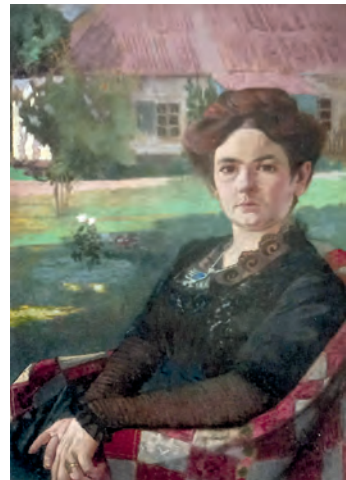
Жіночий портрет. 1911 р.