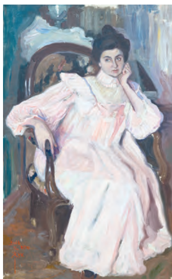
Жіночий портрет. 1901 р.