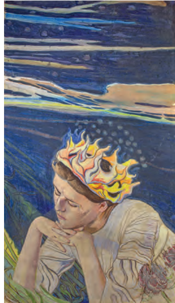
Дівчина з короною з вогню